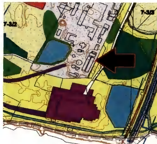
Obr. - Výřez grafická část ÚPM funkční využití území B. 2. schéma řešeného území podle dotčených pozemků

v ploše funkčního využití označené „Plochy výroby a služeb bez negativního vlivu na okolí VS – stav“.